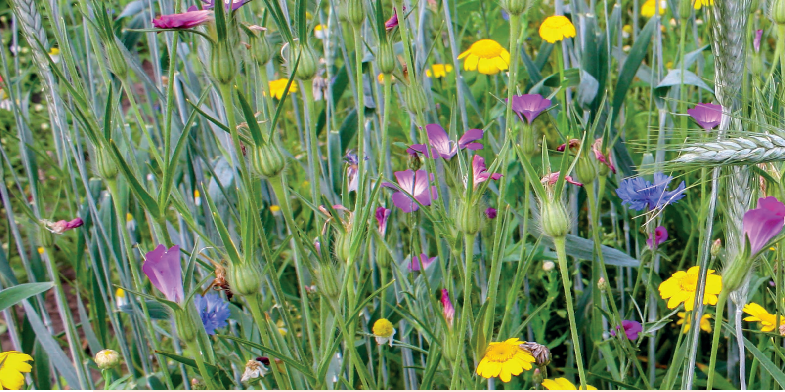
Akkerbloemen met graan.